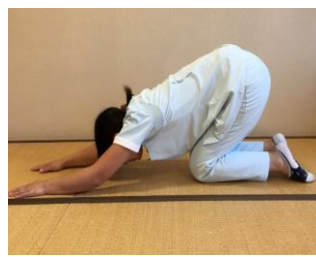
【肩から背中をのばす】

よつんばいになって腰の位置をキープし両手を少しずつ前へ。息を吐きながら、そのままのポーズを保つ。