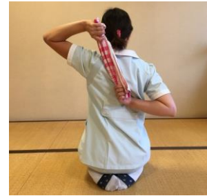
【肩の筋肉をのばす】

図のような形で両手をつなぐ。息を吐きながら引っ張り合う。左右の手をかえて、もう一度トライ。